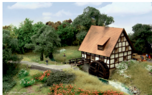
Wassermühle im Kallental

Ob exponiert auf Ihrer Modellanlage oder als romantische Szenerie halbversteckt im Gebüsch - für die mittel- bis norddeutsch inspirierte 'Dörpeder Wassermühle' findet sich immer ein lauschiges Plätzchen. Das filigrane, mit einem Mikrogetriebe gemächlich angetriebene Mühlrad, großflächig gravierte Natursteine in der Sockelzone, das plastische Ziegeldach und zahlreiche liebevoll ausgearbeitete Details bringen echtes Leben in Ihre Dioramen.